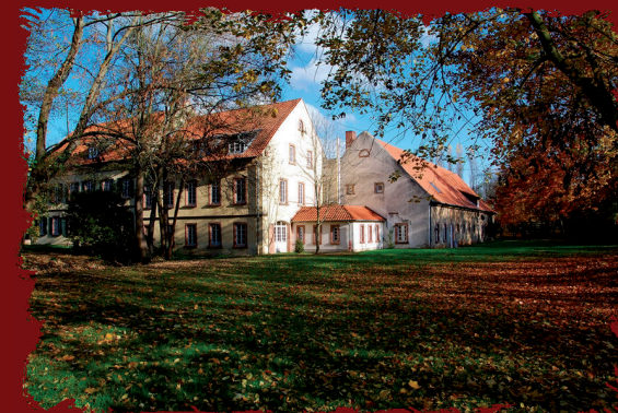
Monsheim /Südlicher Wonnegau