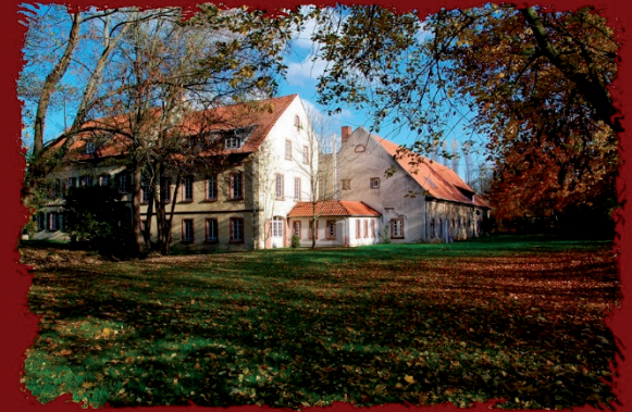
Verbandsgemeindeverwaltung Monsheim „Anhäuser Mühle“

VERBANDSGEMEINDE MONSHEIM DER SÜDEN RHEINHESSENS